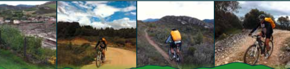
Salinas de Añana Salcedo Ocio Tolono